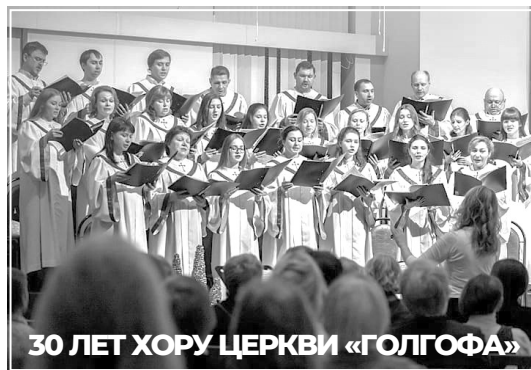
30 ЛЕТ ХОРУ ЦЕРКВИ «ГОЛГОФА»

2021 год – юбилейный для нашей церкви и для нашего замечательного любимого хора!